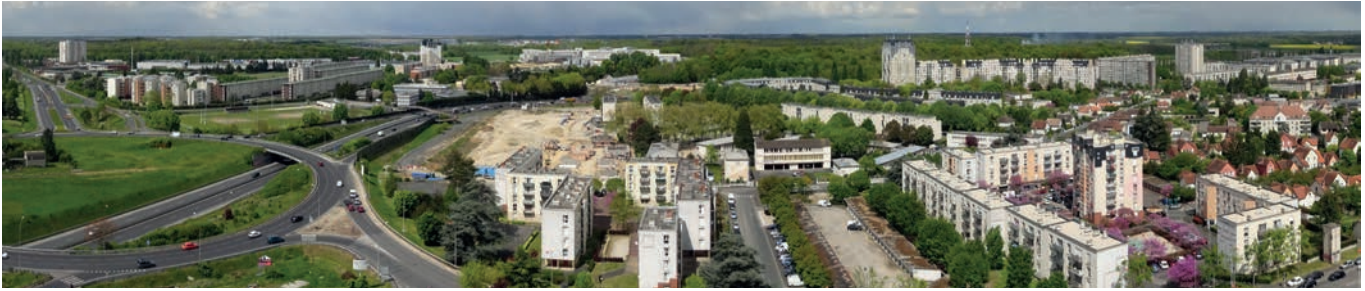
Vue panoramique prise depuis la tour du Tripode, réalisé par Edouard Albert

de l'Anru, seront réintégrés à leur environnement par des désenclavements ponctuels, la constitution d'une nouvelle offre de logements intermédiaires, une diversification fonctionnelle et des liens forts à l'agriculture et la forêt voisines.