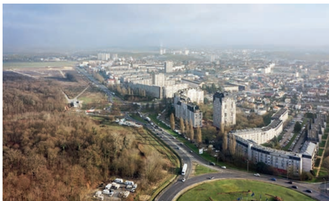
Etat actuel du site

Le périmètre sélectionné pour l'intervention de l'Agence nationale pour la rénovation urbaine se situe sur les Hauts de Melun, en limite Nord de l'aire urbaine francilienne, et renvoie, depuis les accès à la ville, une image périurbaine (rocodes, zones commerciales, grand ensemble déqualifié, ensembles pavillonnaires autarciques). Cette situation positionne pourtant le secteur comme interface entre ville et espaces naturels agricoles et boisés, identitaire de l'Agglomération Melun-Val-de-Seine.