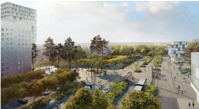
Vue du tram

Le devenir des Hauts de Melun trouve donc cohérence dans de multiples projets ambitieux répondant à des enjeux communs et offrant une nouvelle image au territoire. Ces objectifs partagés veulent supprimer les fractures spatiales et sociales constituées en lien avec l'avènement de l'automobile ; favoriser les déplacements et la vie sociale via de nouvelles porosités, espaces publics fédérateurs et lieux d'intensité ; favoriser un cadre de vie pérenne en lien étroit avec les entités naturelles du territoire ; créer une ville passante et attractive.